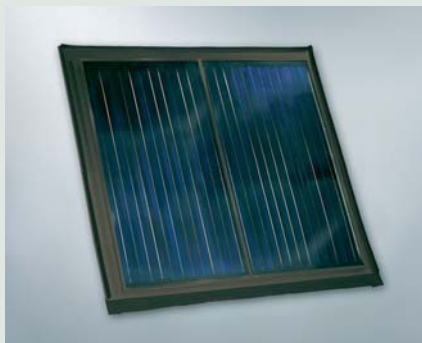
Vitosol 200-F, Tip 5DI

Încă din prima fază de fabricație a panourilor solare Viessmann, s-a avut în vedere aspectul ecologic: componentele din aluminiu sunt executate în proporție de circa 97% din metal provenit din recuperări, evitând astfel procesul poluant și energofag de sinteză a aluminiului din bauxită.